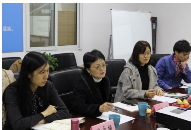
学会开展城市黑臭水体治理技术和工程调研