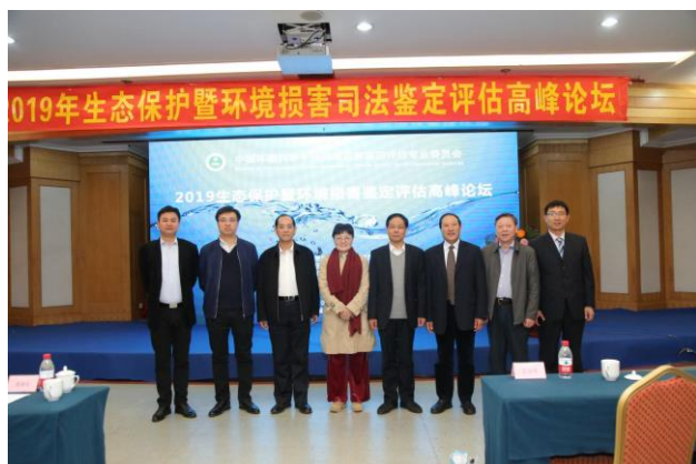
生态保护暨环境损害司法鉴定评估高峰论坛合影