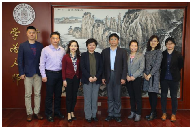
学会赴北京师范大学对接科技成果转化合作