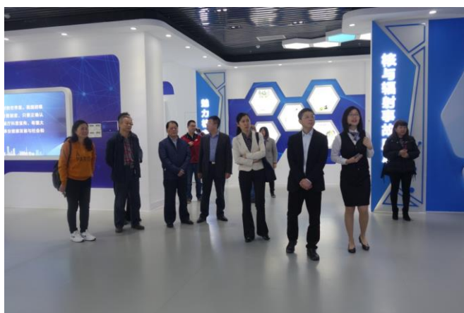
学会系统调研广西部分地区生态环境科普工作的现状和需求